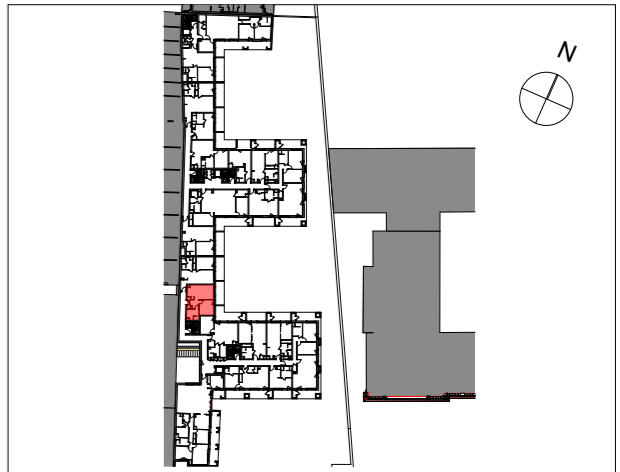
PLAN DE REPERAGE